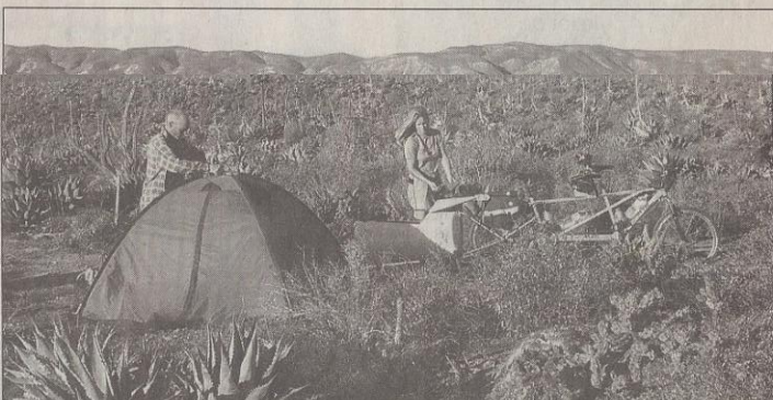
Campement en Basse-Californie, au Mexique, décembre 2005, temps superbe.